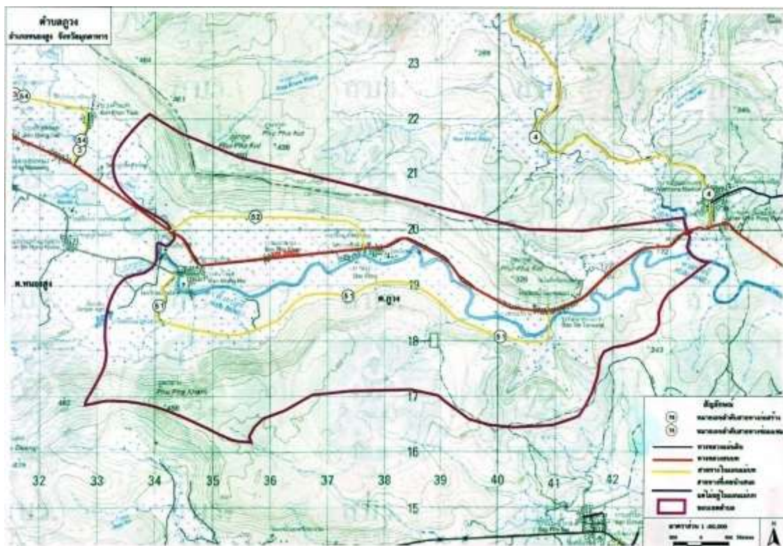
แผนที่แสดงอาณาเขตการปกครองเทศบาลตำบลภูวง